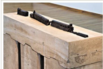
CARLOS HUFFMANN, OBSERVATORIO (MAQUETA), 2013.

En el otro extremo del arco de la tradición monumental se encuentra la obra de Osías Yanov, titulada /<>/<, una elegante síntesis de El canto al trabajo de Rogelio Yrurtia, el gran grupo escultórico que se levanta en Paseo Colón e Independencia. Se trata de una estructura de metal que sirve de escenario y guía para un